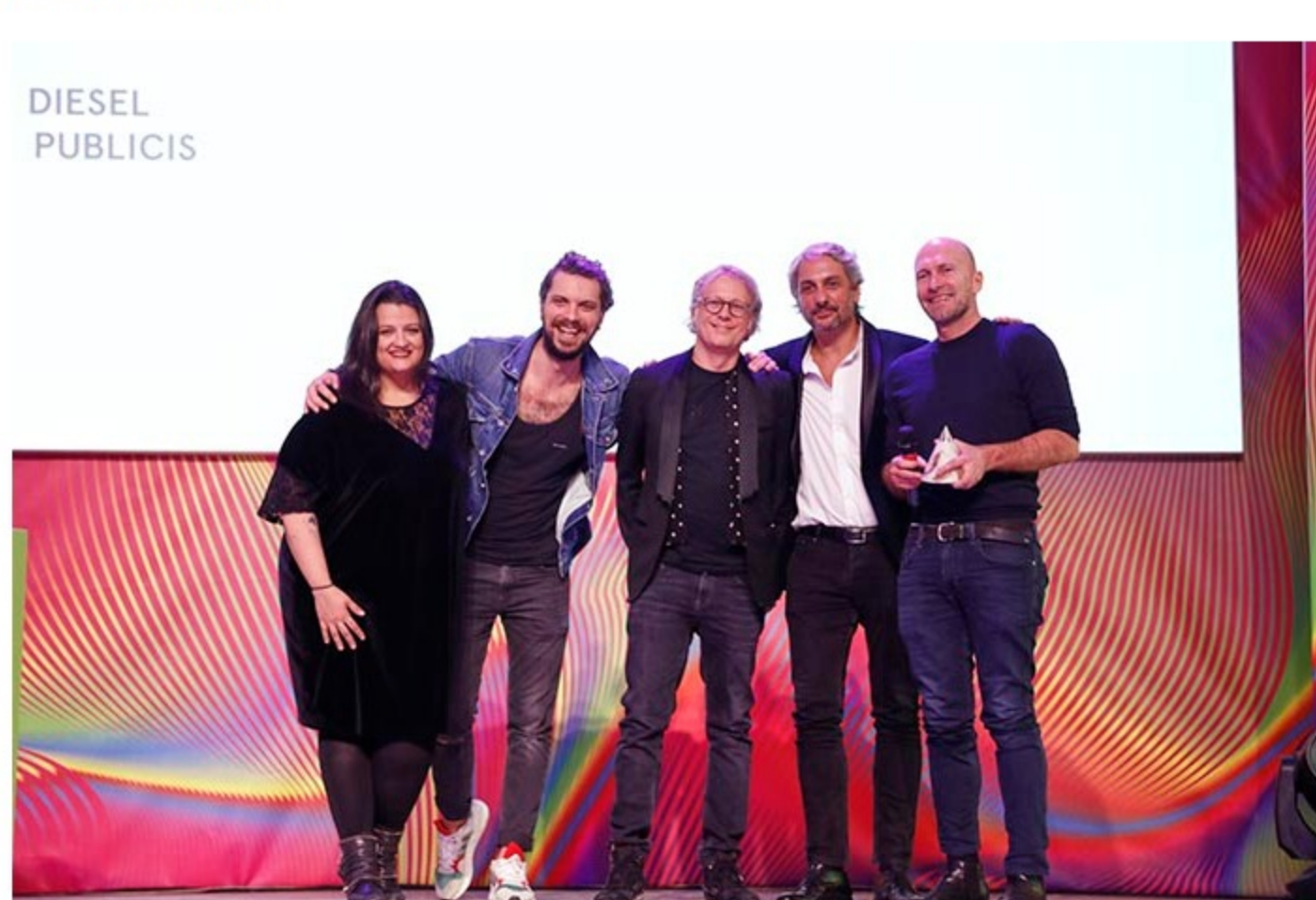
La premiazione del Grand Prix

Ogni giuria è stata composta, oltre che dal Presidente, da sei professionisti soci dell'Adci rappresentativi delle diverse discipline, un professionista esterno proveniente da realtà del mondo della comunicazione e un profilo rappresentativo del mondo "clienti".